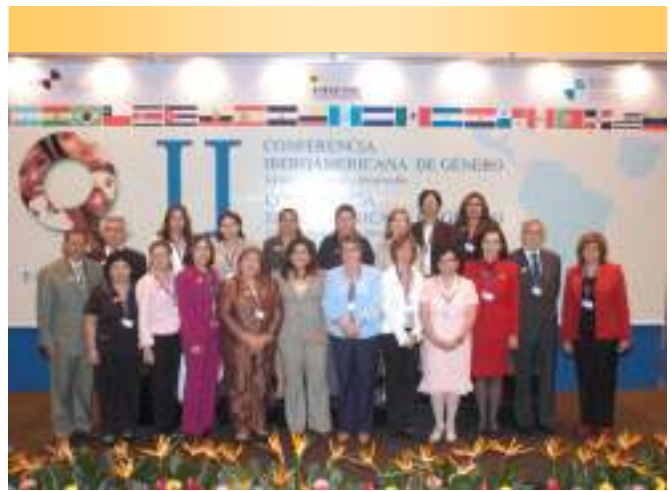
Jefas y jefes de delegación. II Conferencia Iberoamericana de Género: “Género, Juventud y Desarrollo”

“La juventud es la apuesta del presente y del futuro, un actor estratégico del desarrollo, de la innovación y los cambios. Las y los jóvenes son colaboradores valiosos y comprometidos en la construcción de un futuro más próspero, en el que la igualdad y equidad promueven cambios intergeneracionales que permiten la superación de las inequidades entre hombres y mujeres.”